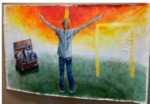
Video zum Bild

"Ich habe das Bild halb gemalen gesehen und es hatte mich schon direkt angesprochen und bewegt, je mehr Teile zum Bild gekommen waren desto mehr wusste ich das es zu mir und meinem Sein passt. Es hat mein Herz wiedergespiegelt.